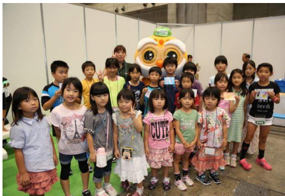
午後の子 キャンセル待ちがでるほど盛況でした